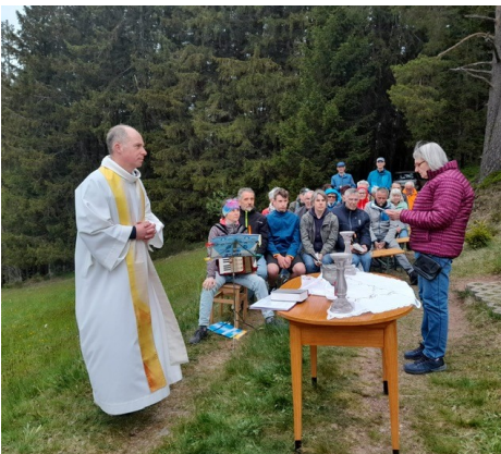
Maiandacht am Jakobsacker