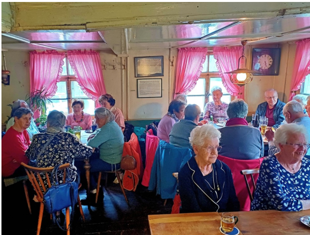
Gute Stimmung in der „Krone“ beim geselligen Beisammensein nach der Maiandacht.